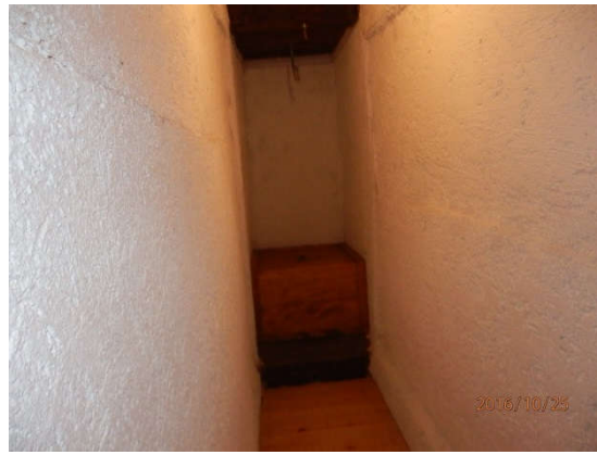
Spavaću sobu roditelja i wc koji ovako izgleda iznutra