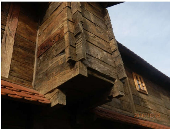
a ovako izvana.