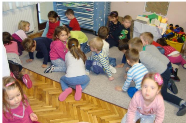
3. Aktivnost Kao mravi

U trećoj temi Razvoj pozitivnog mišljenja dobre povratne informacije dobivamo nakon aktivnosti Dok sunce sja (fotografija 4.) u kojoj djeca pokazuju svoje razumijevanje osjećaja, sa sigurnošću argumentiraju i raspravljaju među sobom, dok nakon plesa i pjesme Walking on sunshine božaju emotikone.