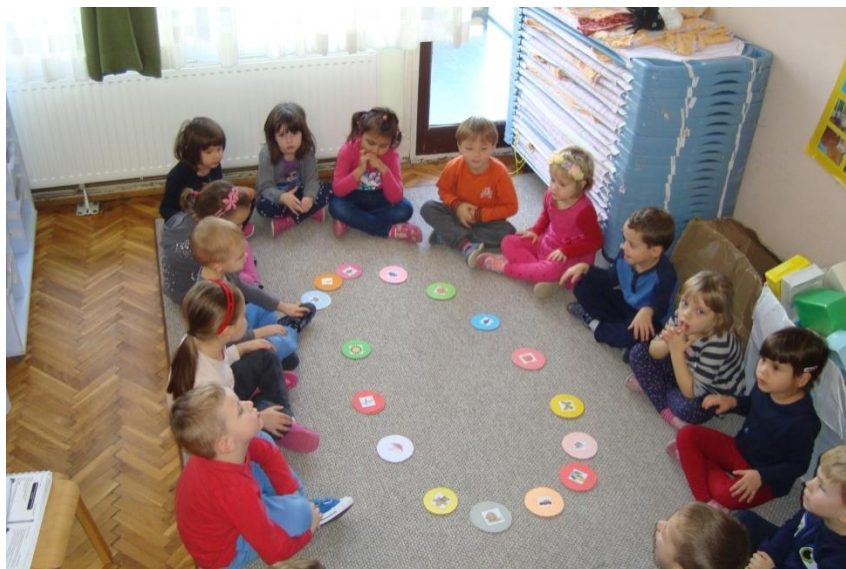
5. Aktivnost Zelda je posebna

Na početku izvedbenog plan i programa Kurikuluma otpornosti realizirali smo roditeljski sastanak na kojem je ovaj kurikulum prezentiran. Prisutno je bilo 19 roditelja koji su aktivno sudjelovali, te je na njihovu inicijativu, zahvaljujući dosadašnjoj suradnji i rezultatima na prethodnim aktivnostima u skupini na zadovoljstvo svih u procesu, dogovoreno da ćemo kući slati zadatke, kako bi se i roditelji mogli aktivno uključiti, te podržati rad odgojitelja u skupini, a sve sa ciljem dugoročnih rezultata.