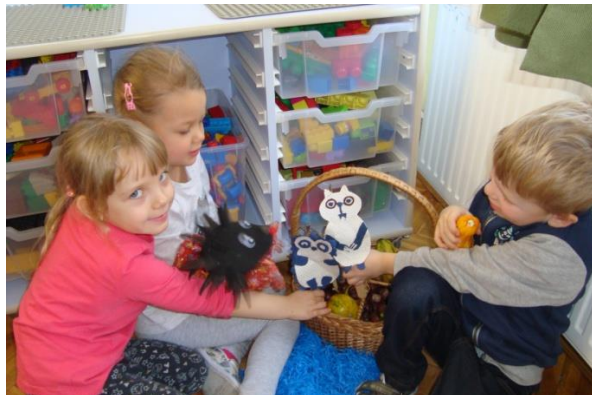
2. Aktivnost Pad u podzemlje

Pad u podzemlje (fotografija 2.) i Kao mravi (fotografija 3.) su aktivnosti koje su ostavile dubok dojam na djecu, pomoću njih su uvidjeli da drugi mogu istu stvar ili događaj vidjeti i doživjeti drugačije, te da uvijek možemo pitati i provjeriti kako se netko osjeća ili kako je doživio određenu situaciju. Dugoročno su utjecale na njihovu promjenu ponašanja u smislu empatije i osvještavanja kako se netko sada možda drugačije osjeća i drugačije doživljava određenu situaciju.